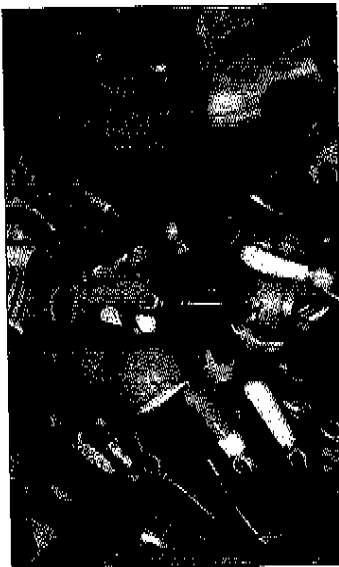
Sortiertes Durcheinander: Die Figuren bewahrt Jürgen Kleinhaus in Kisten auf.